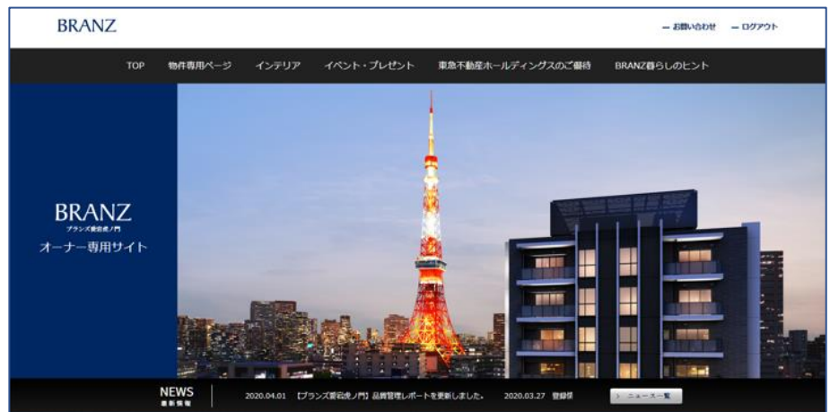
「オーナー様専用ページ」