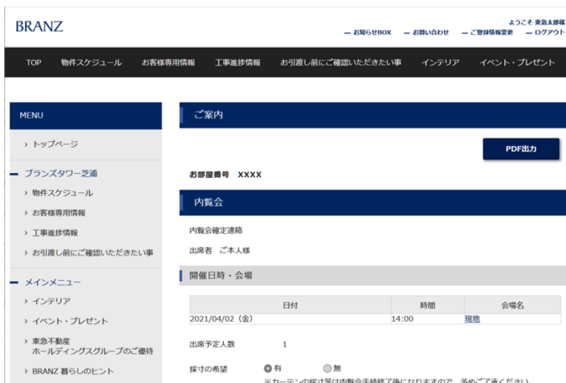
「イベント登録・閲覧ページ」