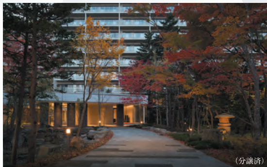
ブランズ札幌中島公園

※「アルス」シリーズを含む1978年～2023年における実績。2024年1月現在販売中物件を除く。