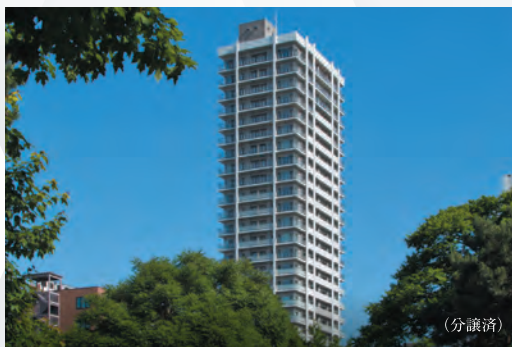
ブランズタワー札幌