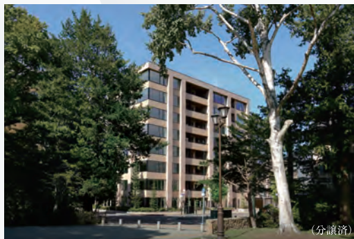
ブランズ円山外苑前