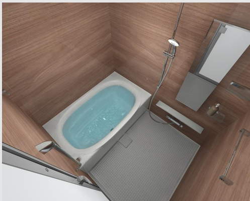
①Aタイプモデル / ミナモ浴槽 08合成によるイメージ画像です。