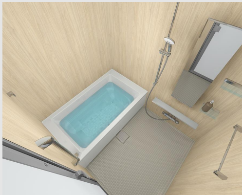
②Oタイプ/ストレートライン浴槽